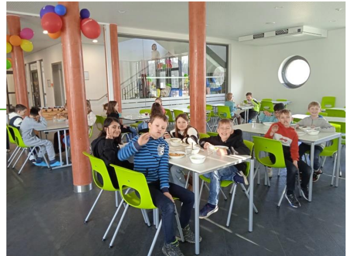
Ein eigener Speisesaal zum gemeinsamen Mittagessen