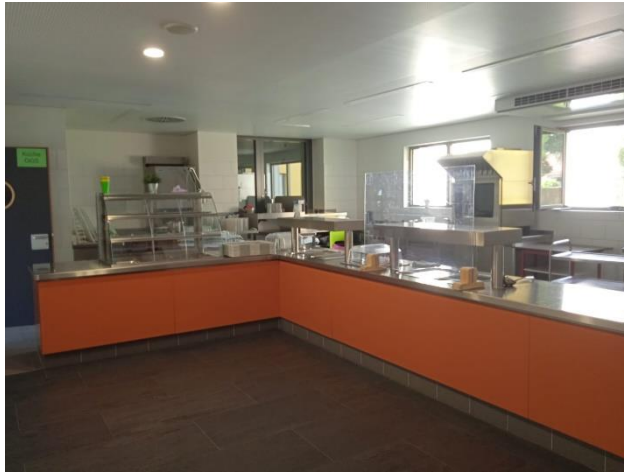
Eine moderne Ausgabeküche

Räumlichkeiten: EG – OGS Gemeinschaftsräume